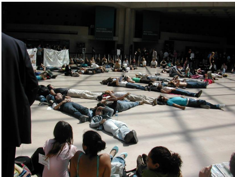
Përpara Luvrit demonstratat e studentve te arkitekturës