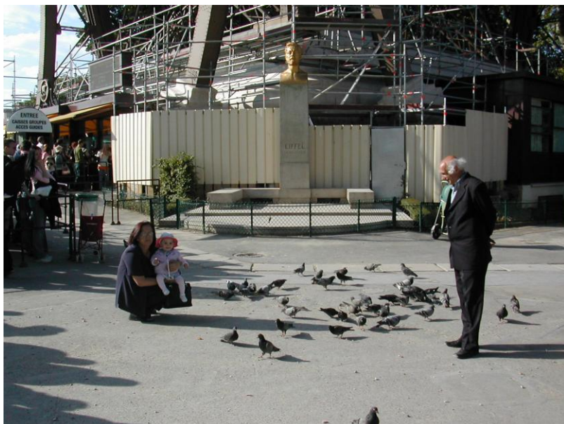
Përpara kullës së Ajfelit