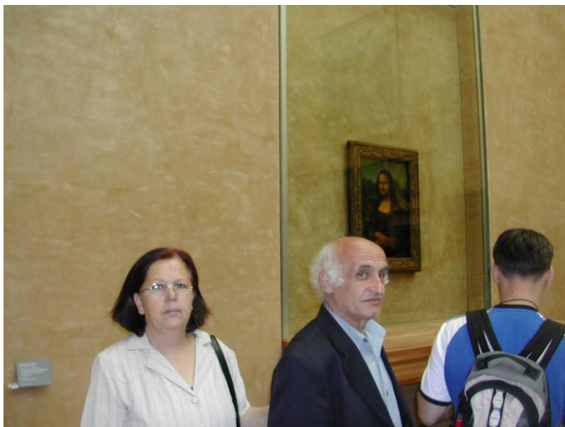
Përpara M o n a L i z ë s