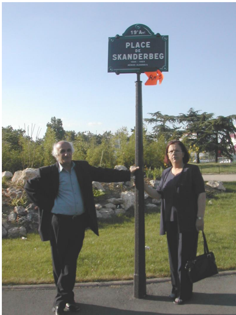
Sheshi i Skenderbegut në Paris