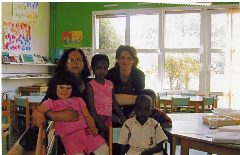
Gruaja me fëmijët e çerdhes në një lagje të Parisit

punësuar në çerdhen e vetme në Kërçovë edhe atë qysh prej themelimit që edhe pak prej aty do të pensionohet.