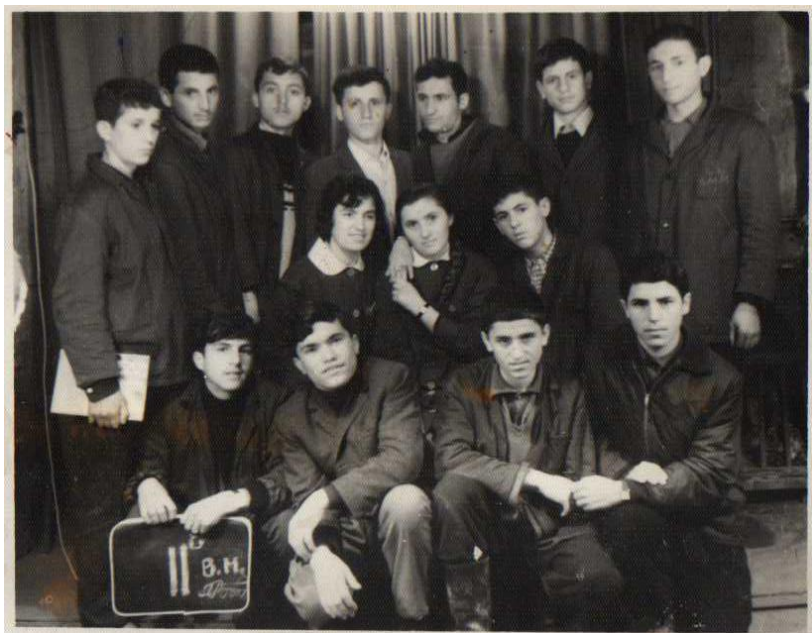
Fotografia e klasës së dytë të fotografuar në kala të Kërçovës.