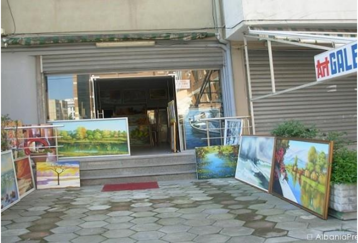
Në foto "ArtGaleri"